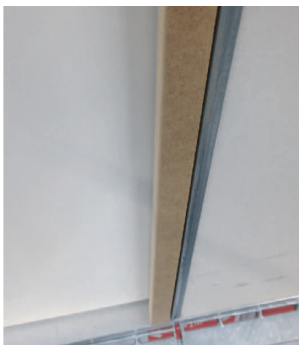
3. Clipser sur toute la hauteur.