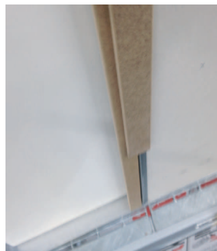
5. Le couvre joint permet une finition complète et de dissimuler la partie métallique .