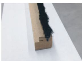
Habillage latéral vertical avec balai.