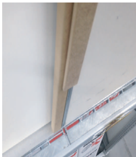
4. Coller le couvre joint sur l'habillage