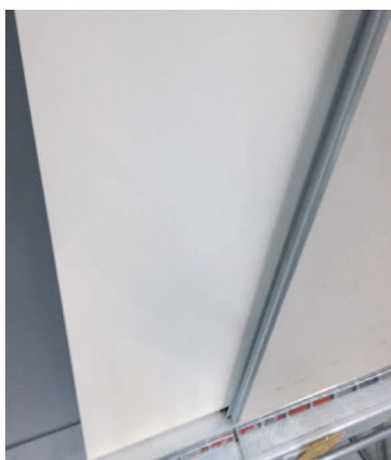
1. Montage du kit