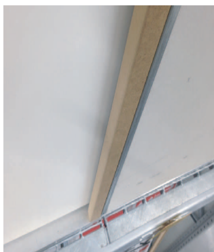
2. Clipser l'habillage latéral vertical dans la partie métallique