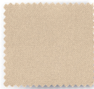
DRAP DE LIN