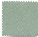
VERT DE GRIS