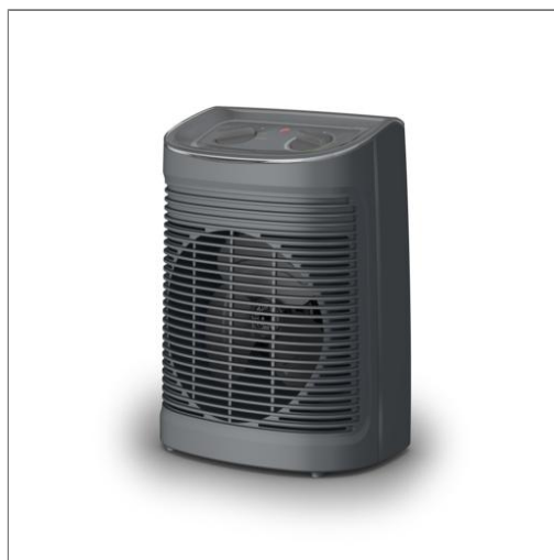
INSTANT COMFORT AQUA Chauffage soufflant S06511F2