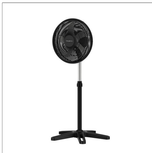
Turbo Essential, Ventilateur sur pied, Ecoconçu, Performant, Compact Ventilateur sur pied VU3110FO