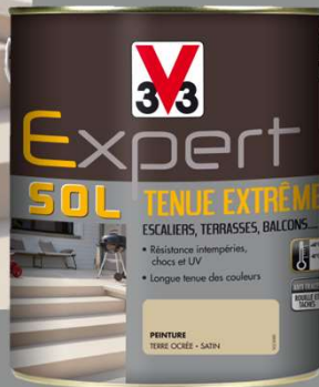
Formats : 0,5L - 2,5L - 5L