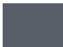
BLEU ENCRÉ Myrtilles du Massif Central