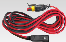
Rallonge 2.5 m - 029057