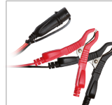
Pinces (45 cm)