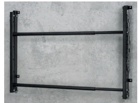
Faible encombrement de Pliage