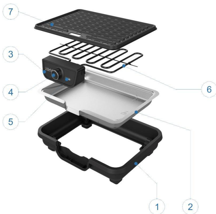
Illustration indicative pour la position du bouton de réglage (4)