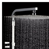
Pomme haute 300x300 système anti-calcaire