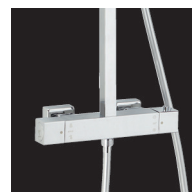
Thermostatique cartouche Vernet