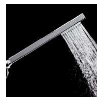
Douchette laiton chromé 1 jet système anti-calcaire