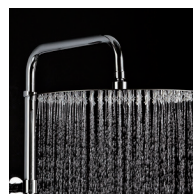
Pomme haute diam. 300 orientable système anti-calcaire