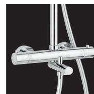
Robinet thermost bain douche