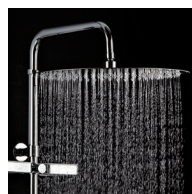
Pomme haute diam. 300 orientable système anti-calcaire