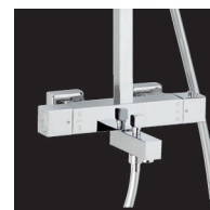
Robinet thermost bain douche