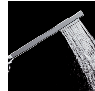
Douchette en laiton chromé 1 jet