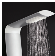
Aspersion haute Energic Zone