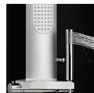
Douchette 1 jet ABS chromé