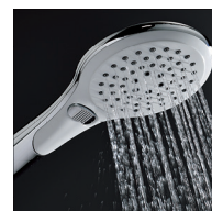
Douchette 3 jets économie d'eau