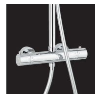
Thermostatique cartouche Vernet