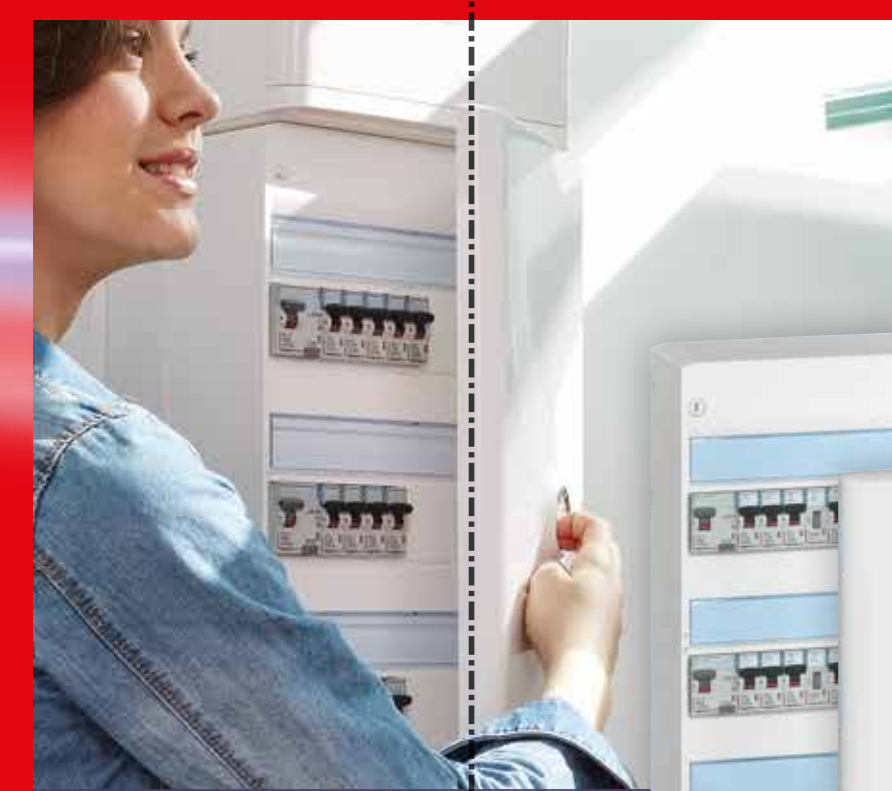
Intégration parfaite dans le décor

À équiper d'une porte blanche ou transparente (vendue séparément)