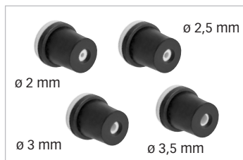
Livrée avec 4 buses céramique Delivered with 4 ceramic nozzles