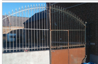
Idéal pour gros travaux de sablage Ideal for big sandblasting work

Livrée avec tuyau et manomètre 4 buses céramique ø 2 / 2,5 / 3 / 3,5 mm Delivered with hose and manometer 4 ceramic nozzles ø 2 / 2,5 / 3 / 3,5 mm