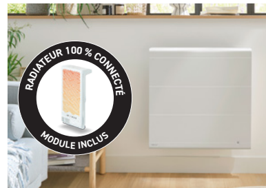
Radasoft 100% connecté