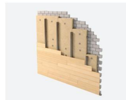
D Fixation du parement de finition