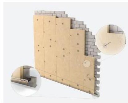
B Fixation de l'isolant