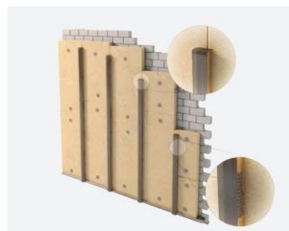
C Fixation des ossatures et pose des bandes de protection sur chevrons