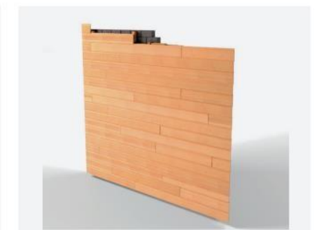
E Fin de chantier (exemple de parement)