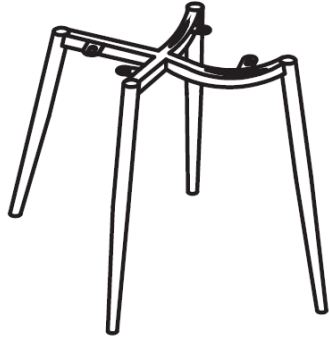
B x 1