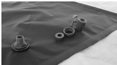
1. Dévissez la grande bague de la vanne et récupérez la pièce intérieure.