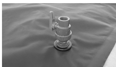
5. Positionnez le corps de la vanne, poignée vers le haut, puis vissez la grande bague jusqu'au serrage complet