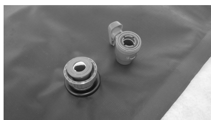
4. Vissez la pièce intérieure comme sur la photo ci-dessus