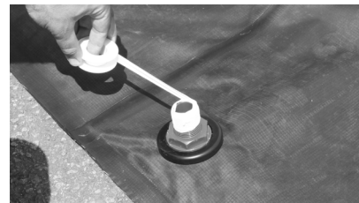
3. Appliquez le téflon sur l'axe fileté. Faire 4 ou 5 tours maximum.