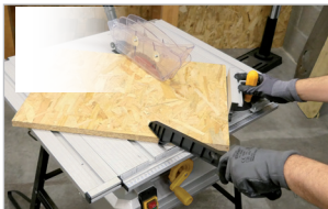
Cartier de lame transparent Transparent blade guard