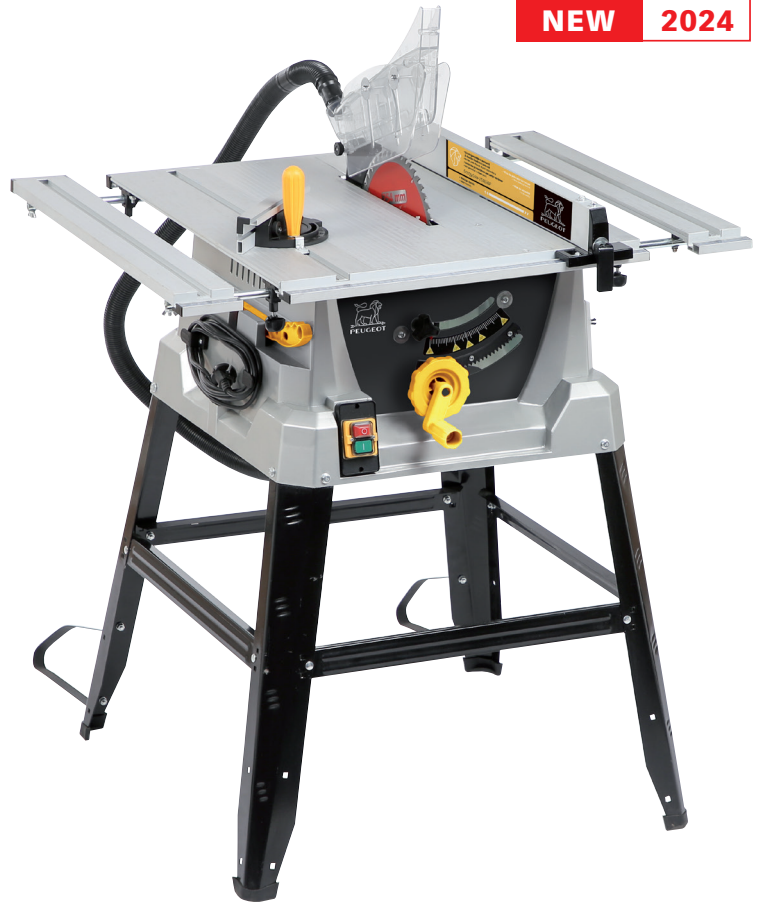
Table: 644x756/956 mm