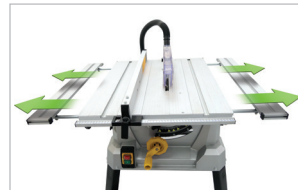
Extensions de table, jusqu'à 956 mm Table extensions, up to 956 mm