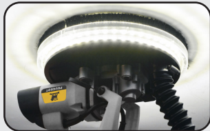
Eclairage par LED LED Lighting