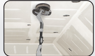
Ponçage au plafond sans forcer Easily ceiling sanding