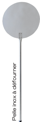
Pelle inox à défourner