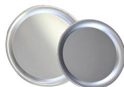
Plat alu 40 et 35 cm de diamètre