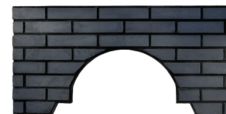
Façade Brique noire