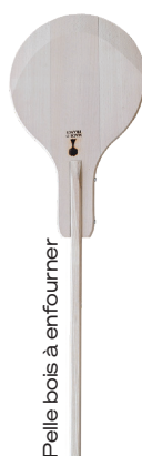
Pelle bois à enfourner