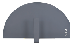
Mini porte acier