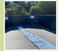
Feutre de fond

Le kit de chacune des piscines JUSTapposé comprend :