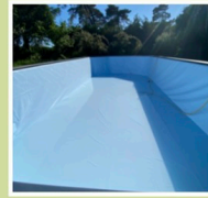
Liner 75/100 traité anti-UV