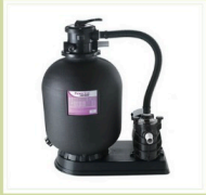
Système de filtration 8m 3 / h