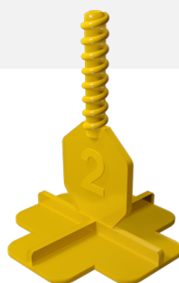
50 CROISILLONS EN + 2 MM