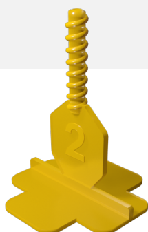
30 CROISILLONS EN i 2 MM