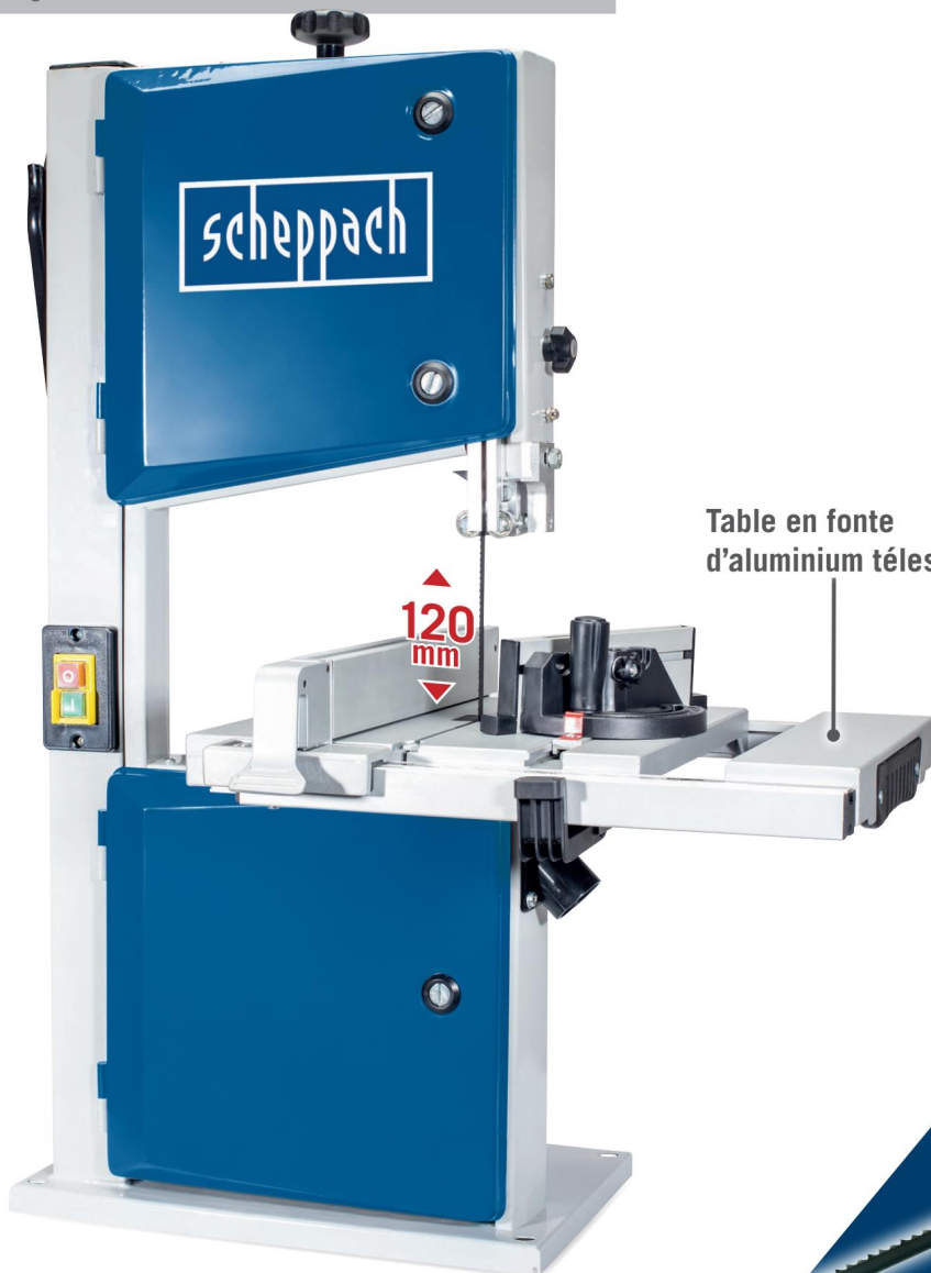
Table en fonte d'aluminium télescopique