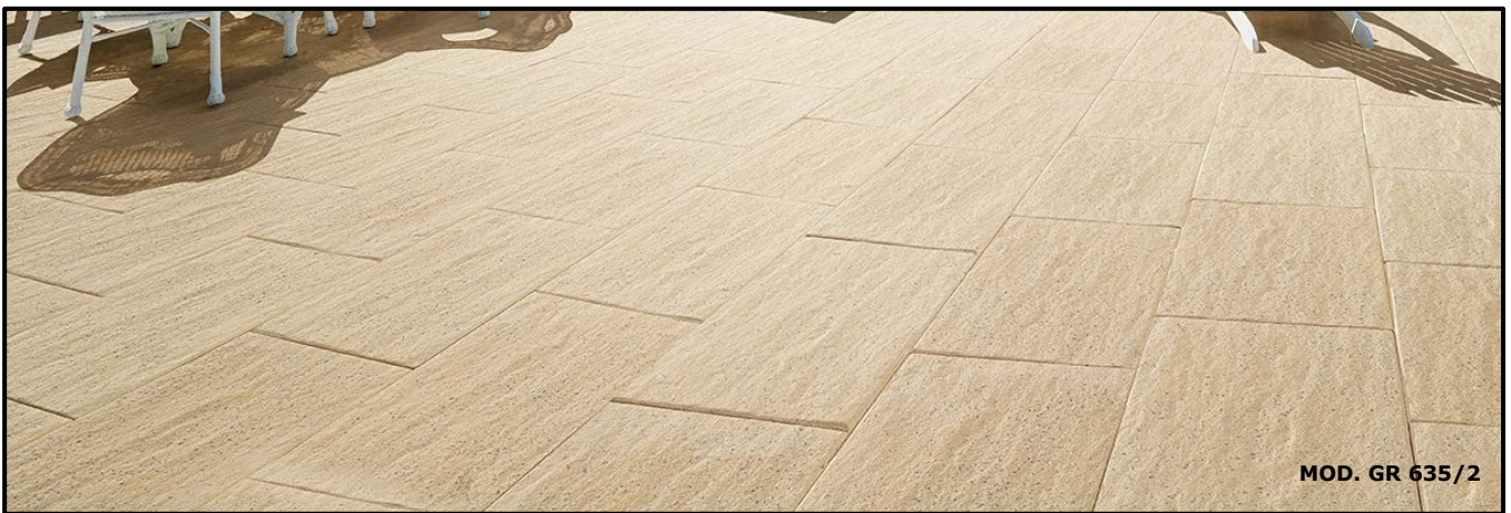
MOD. GR 635/2