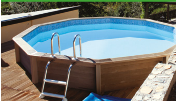
Composition du kit: bassin; échelles, kit filtration; margelle; liner; kit plomberie.