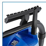
RANGEMENT FACILE DES ACCESSOIRES