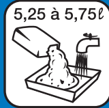
Taux de gachage