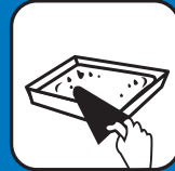
Durée de vie du mélange