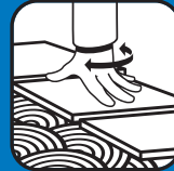
Ouverture au passage