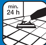
Délai avant jointoiment