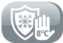
Fonction hors gel