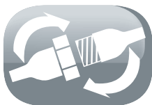
Système Quick Connect à visser