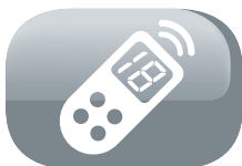
Télécommande avec écran de contrôle LCD