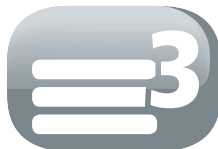
3 couches de filtre