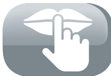
Fonctionnement grand silence