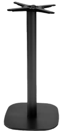
mange-debout H 110 cm