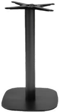
standard H 73 cm

Tous nos piétements de table sont disponibles en 3 hauteurs :