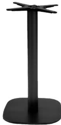
snack H 90 cm